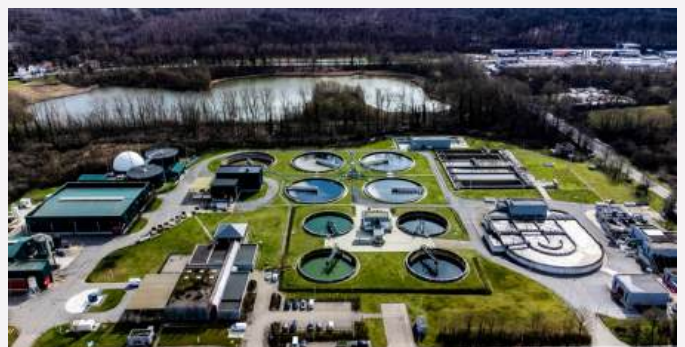
STEP de Basse Wavre