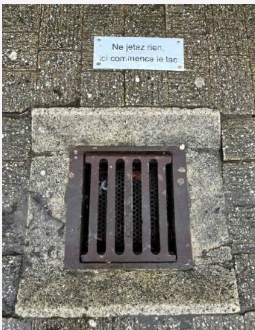
Avaloir du piétonnier (centre-ville)

Ce souci trouve son explication à l'époque du raccordement aux égouts. En effet, ces derniers n'auraient pas été réalisés correctement pour certains ménages, restaurants ou entreprises. Cette malfaçon détourne ainsi des eaux polluées vers le lac au lieu d'être acheminées vers la STEP pour être traitées pouvant engendrer de graves conséquences sur la faune et la flore du lac. La problématique a été remontée à la commune en 2019 mais, à ce jour, aucune investigation concrète n'a été menée à ce sujet.