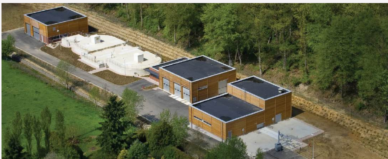
STEP de Profondval

Enfin, passé cette dernière étape, les eaux sont rejetées dans le ruisseau. Des contrôles de qualité sont régulièrement effectués afin d'éviter tout dépassement de normes. Concrètement, il faudra 24h à une goutte d'eau entrée en STEP pour se retrouver dans la rivière.