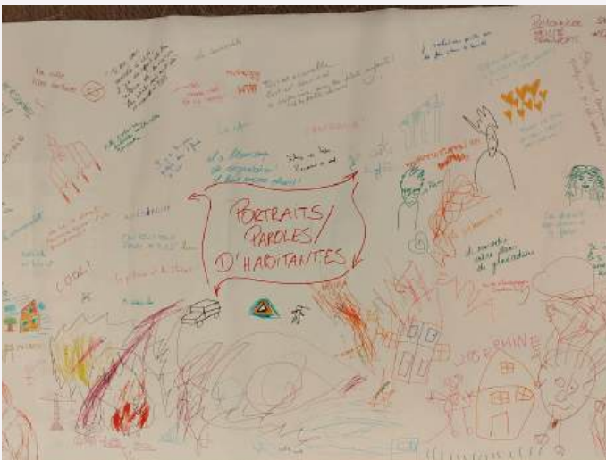
Fresque participative réalisée lors du week-end festif Happy OLLN au Musée L- 15/16 novembre 2025